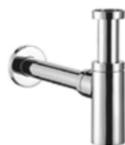
sifon JIKA Mio