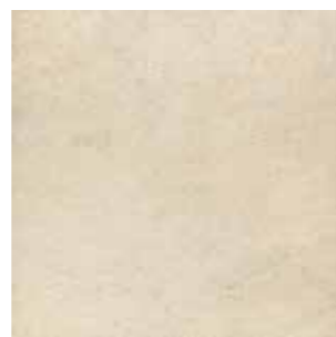
Marazzi Stonework, white