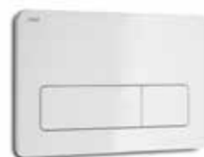
WC tlačítko JIKA Dual Flush