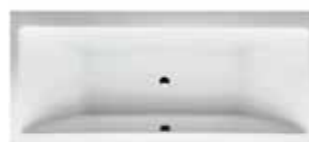
vana Laufen Pro