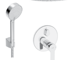
sprchová sestava HANSA