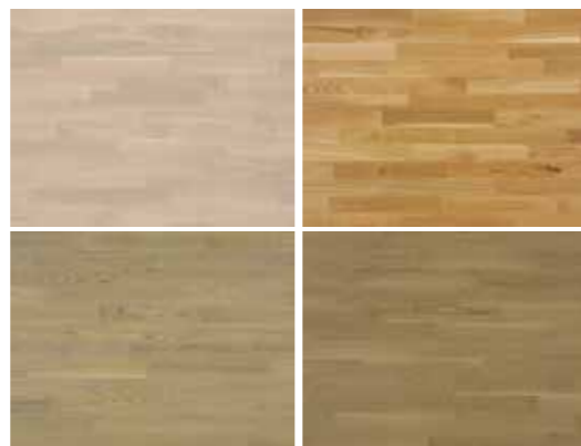
Výběr ze čtyř dekorů podlah

Intenzivní zeleň s automatickou závlahou