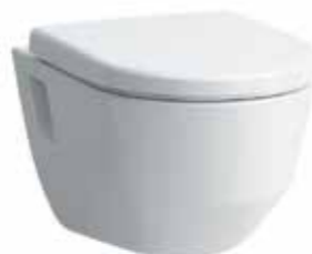
WC Laufen Pro