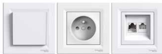
zásuvky a vypínače SCHNEIDER Asfora

Audiotelefon s přípravou pro videotelefon